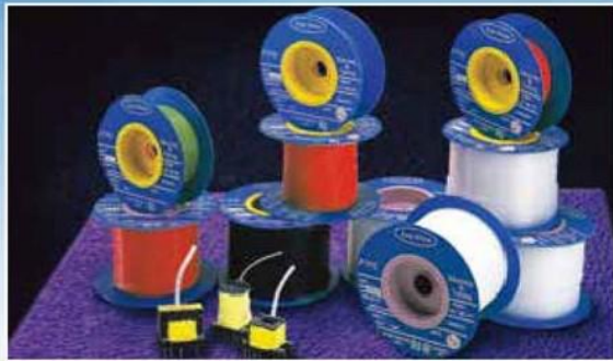
PT.F.E. Sleeveing 聚四氟乙烯/絕緣套管