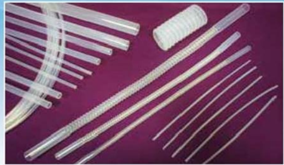
PFA Tubing 半導體耐強酸管/螺旋管 PFA SEMI-Conductor Tubing & Spiral