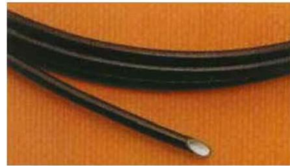
ETFE Tubing / Medical Tubing 乙烯四氟乙烯管/醫療管 Auto Fuel Tubing / Oil plug Tubing 汽車燃料管/油塞管